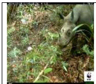
Gambar 3. Jalur lintasan ( Passage and Wallow )