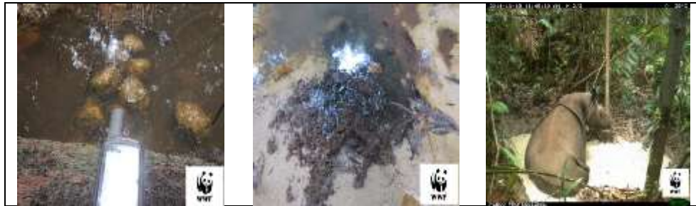
Gambar 2. Kotoran dan berkubang ( Feses )