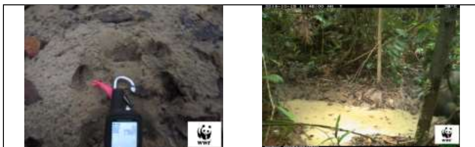
Gambar 4. Tapak dan Kubangan ( Footprint and Puddles )