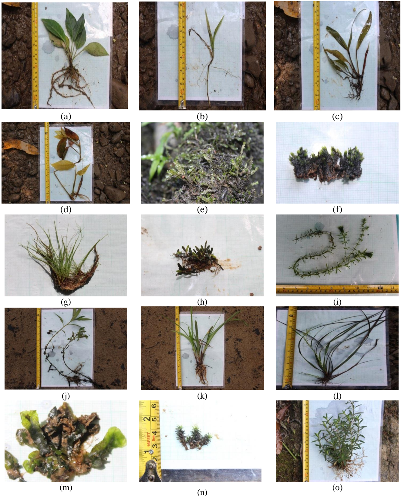
Gambar 2. Lima belas jenis makrofita akuatik ditemukan di Sungai Embau, diketahui jenis emergent (a) Calla sp., (b) Eleusine indica (L.) Gaertn, (c) Homalomena sp., (d) Donax toxifolius , (e) Chiloscypus polyanthos , (f) Fissidens toxifolius (L) Vhal., (g) Eleocharis pervula , (j) Polygonum sp., (k) Cyperus pilosus L., (l) Fluminea festucacea , (m) Monosolenium tenerum , (n) Dichodontium sp., (o) Rosmarinus sp. Sedangkan jenis submerged diketahui jenis (h) Glossostigma sp., (i) Eleodea sp.