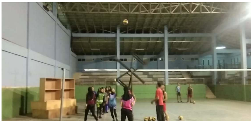
Gambar 2. Pemakaian Alat Blok Yang Dihasilkan