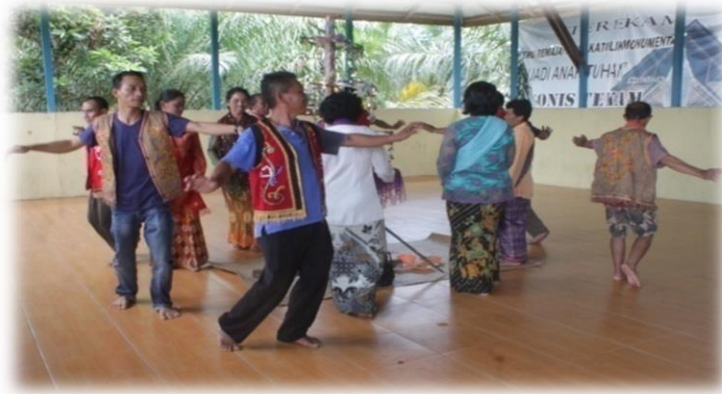
Gambar 4. Tari Entarai

Berdasarkan jenis pola garapannya tari dapat dibagi menjadi dua yaitu tari tradisional dan kreasi, sedangkan dari pola garapannya yang sederhana Tari Entarai ini termasuk kedalam jenis tari tradisional yang memiliki sebuah pola tari tradisi rakyat.