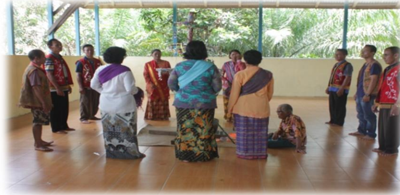
Gambar 2. Penari Melingkari Properti

membentuk posisi melingkari properti yang berupa Tajau (tepayan yang berisi Tuak), bunga teripak dan tabas.