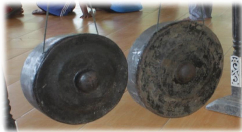
Gambar 1. Entarai (2 buah Gong)

Penelitian ini membahas tentang “Bentuk Penyajian Tari Entarai pada Suku Dayak Ketungau Sesaek ” di Dusun Gonis Rabu Desa Gonis Tekam Kecamatan Sekadau Hilir Kabupaten Sekadau dengan didukung teori-teori yang relevan. Dalam penelitian mengungkap bahwa Tari Entarai ini merupakan sebuah tarian tradisional yang judul tarinya diambil dari nama alat musik tarian itu sendiri yaitu dua buah gong pengiring tarian yang disebut Entarai .