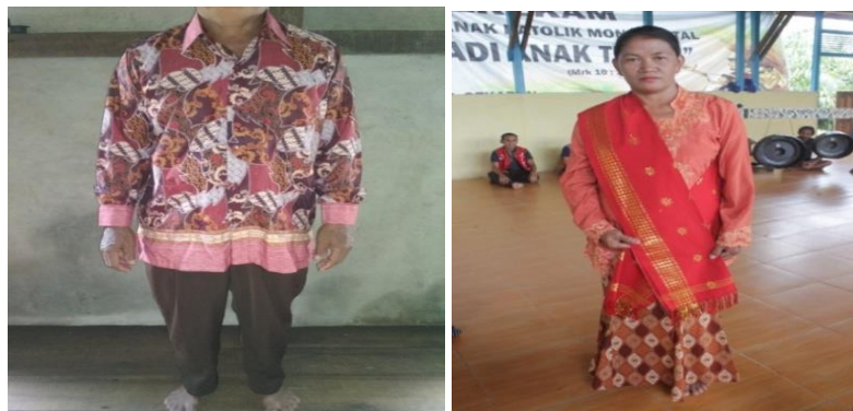
Gambar 7. Busana Laki-laki Dan Perempuan

Berikut gambar busana yang digunakan pada penari perempuan dan Laki-laki :