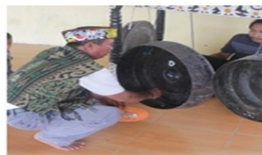
Gambar 3. Sesajian dan Ritual

Tari Entarai pernah ditarikan oleh penari Pria pada tahun 1996 dalam acara penyambutan tamu Agung, penyambutan Uskup dalam Peresmian Gereja Katolik Santa Gema Galgani. Tari Entarai ini ditarikan oleh penari pria hanya ditahun