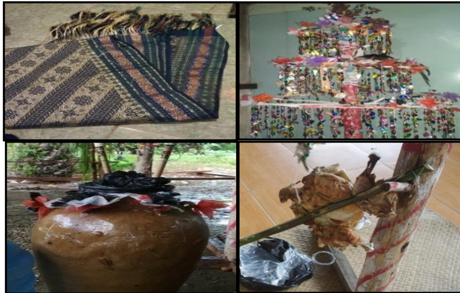
Gambar 8. Properti ( Selendang, Bunga Teripak, Tempayan, Tabas )

atau daging ayam. yang sudah dibakar atau pun sudah direbus.