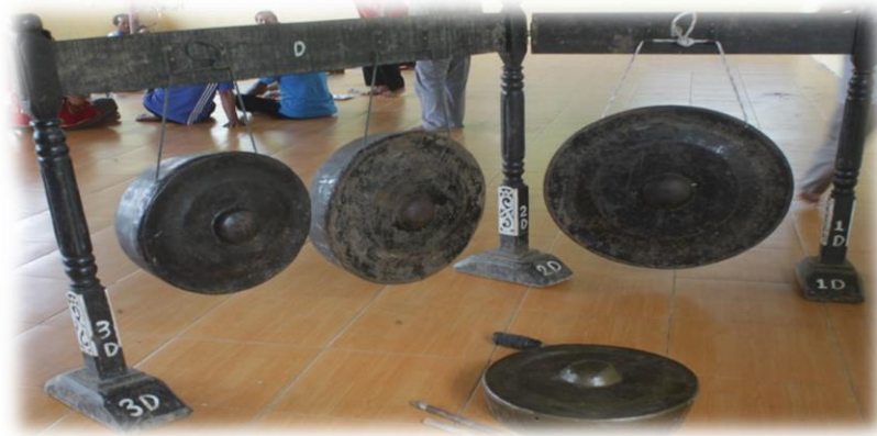
Gambar 5. Alat Musik

gong ukuran 58 cm, satu gong ukuran 46 cm dan gong yang ukuran 43 cm disebut Ketawa , sedangkan Gong yang berukuran 58 cm dan berukuran 46 cm disebut Entarai .