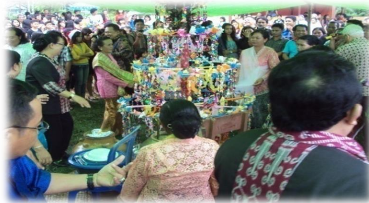
Gambar 9. Tempat Pertunjukan

Tari Entarai ditarikan dipanggung terbuka dinikmati dan ditonton oleh