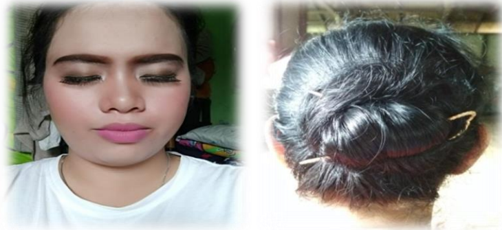
Gambar 6. Risa Wajah Dan Sanggul

sedangkan tata busana merupakan penataan pakaian dan atribut yang digunakan sesuai dengan peranan.