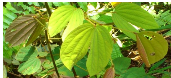
Gambar 1. Tumbuhan akar bambak.

penelitian yang dilakukan oleh Fermanasari, dkk., (2016) menyatakan bahwa fraksi metanol daun akar bambak memiliki aktivitas antioksidan.