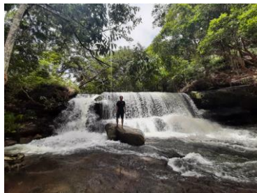
Gambar 1 Air Terjun Pancur Aji

Wisata Pancur Aji merupakan wisata alam yang memperlihatkan pemandangan air terjun yang masih alami jauh dari keramaian kota sehingga pengunjung bisa menikmati sensasi kesegaran saat berada di Pancur Aji. Selain itu, pengunjung juga dapat menikmati keindahan maupun keunikan dari flora fauna yang ada.