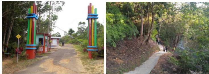
Gambar 2 Akses Jalan Menuju Wisata Pancur Aji