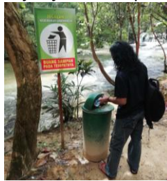
(b) Sarana Persampahan