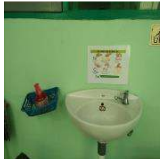
Gambar 4. Melengkapi sarana cuci tangan di kantin