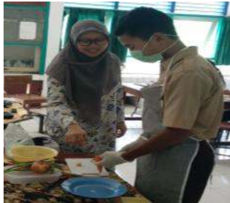
Gambar 6. Praktik mengelola bahan makanan, petugas menggunakan APD

Pada pelatihan ini juga diajarkan tentang adab makan di kantin sekolah pada pengelola kantin dan perwakilan siswa OSIS. Adab makan sejak memesan amkanan, selama makan dan selesai makan. Hal ini karena menurut pengakuan dari peserta bahwa makan jajanan sekolah seringkali dilakukan dengan berdiri, sering lupa berdoa, mengambil makanan menggunakan tangan langsung, padahal telah disiapkan alat untuk mengambil makanan. Pada kegiatan ini sebelum dan setelah diberikan pelatihan adab makan, terdapat perubahan hasil yang menunjukkan bahwa pengetahuan dan sikap peserta untuk melaksanakan adap makan sebelum makan, selama makan dans etelah makan lebih baik. Perubahan sesuai dengan hasil riset (Noviyani, 2013) bahwa perubahan pengetahuan dan sikap menuju lebih baik dapat diperoleh dari kesan di dalam pikiran manusia akibat dari penggunaan panca indera. Pratiwi, Sanubari, Christian, & Noer, (2017) menyampaikan bahwa sikap dan tingkahlaku yang bergerak menuju lebih baik terjadi karena rangsangan yang didapat terus menerus dan hasil dari belajar terus menerus yang dilaksanakan seseorang. Berikut gambar-gambar pembentukan kantin sehat: