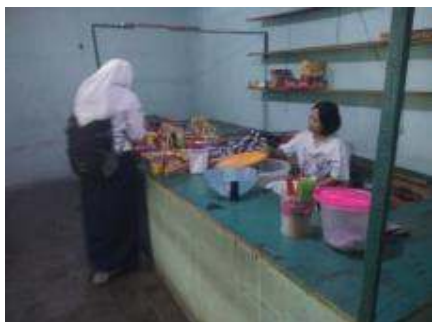
Gambar 1. Suasana Kantin 1

Gambar berikut adalah kondii awal kantin: