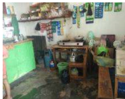
Gambar 2. Suasana Kantin 2