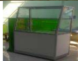
Gambar 7. Persiapan Sarana Prasarana kantin