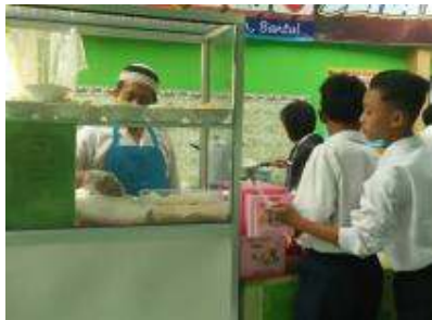
Gambar 8. Penjual kantin sedang melayani pembeli (siswa)