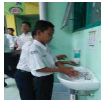
Gambar 5. Siswa mencuci tangan sebelum makan

Solusi pelaksanaan kegiatan ini didasari oleh penelitian (Irwandi, S., Ufatin, 2016) tentang peran sekolah dalam menumbuhkembangkan perilaku hidup sehat pada siswa sekolah. Program yang dilakukan melalui membuang sampah di tempat sampah, mencuci tangan sebelum dan setelah makan, makan dengan makanan yang sehat dan bersih yang