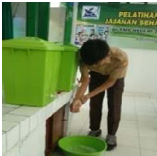
Gambar 3. Praktek mencuci tangan

Berikut merupakan gambar pelaksanaan pelatihan dan pelaksanaan cuci tangan: