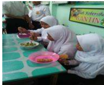
Gambar 9. Siswa jajan sedang makan di kantin.