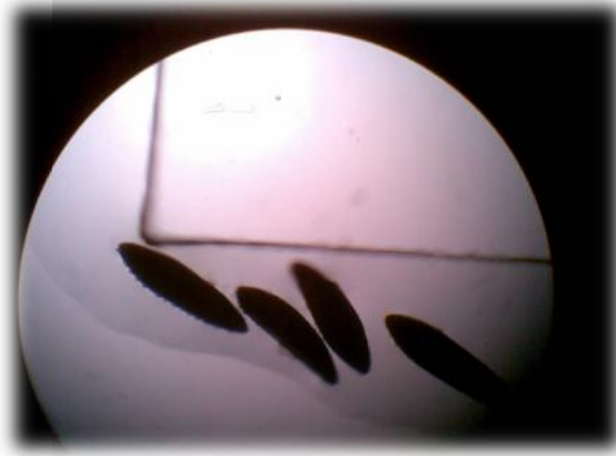
Gambar 3. Telur Aedes berbentuk bulat lonjong dan berwarna hitam (perbesaran 10x).

Hal ini berbeda dari morfologi telur nyamuk Anopheles yang mempunyai pelampung pada kedua sisinya dan nyamuk Culex yang bergerombol seperti peluru. 17-19