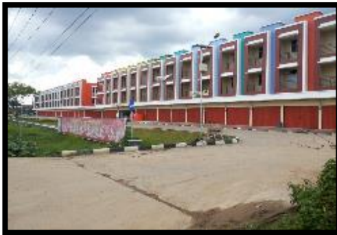
Gambar 3. Kondisi Ruko Anggrek Pontianak