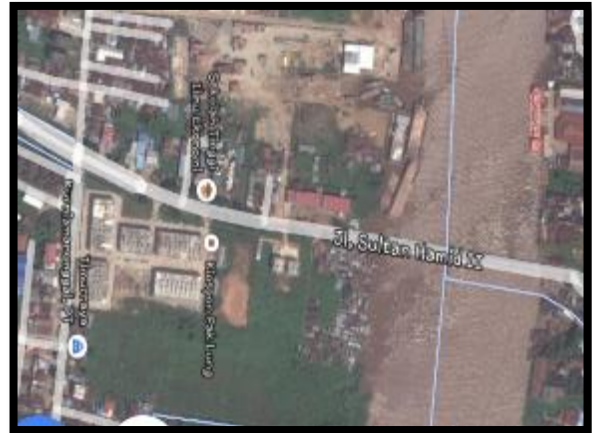
Gambar 2. Situasi Ruko Anggrek Pontianak Dan Jembatan Landak

Berikut kawasan perdagangan Ruko Anggrek Pontianak dan Jembatan Landak yang akan dilakukan pengamatan dan survey: