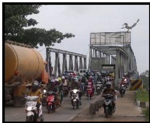
Gambar 4. Kondisi Jembatan Landak

Berikut merupakan gambar kondisi Jembatan Landak.